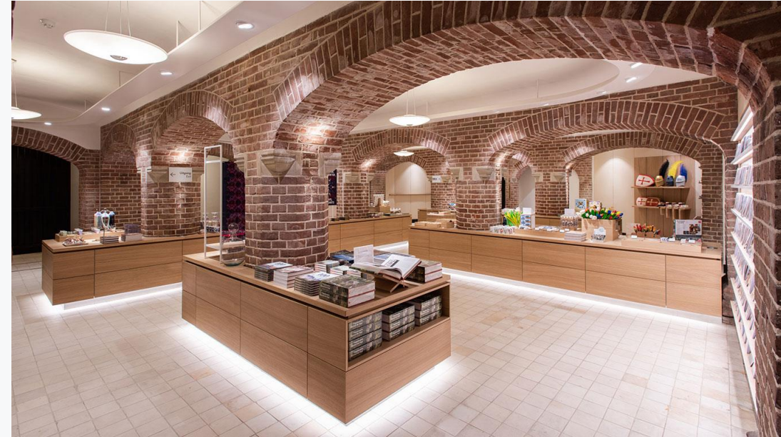
Museumwinkel kasteel De Haar, ontworpen door Here We Architecten (HWA)